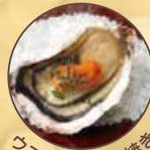
ふじと牡蠣醤油焼き ☞