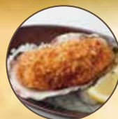
カキフライ 〇 ☞