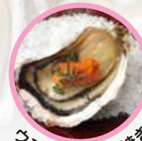
うまみ牡蠣醤油焼き