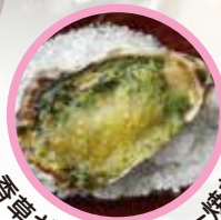
春葱ガーリックバター焼き 〇時