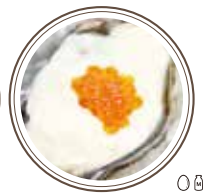
サワークリームとイクラ