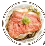
ローストビーフとわさび