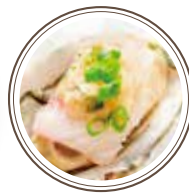
魚介と葱塩ソース